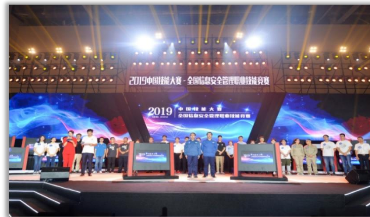
2019中国技能大赛—全国信息安全管理职业技能竞赛（国家级二类赛）