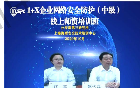
（中级）线上师资培训班