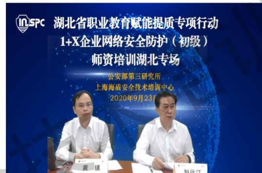
（初级）线上师资培训班