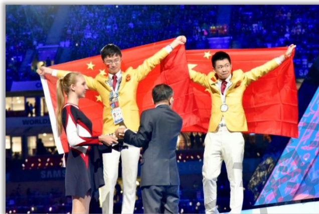
海盾培养选手获得世赛银牌