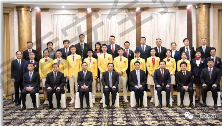
领导接见世赛获奖选手