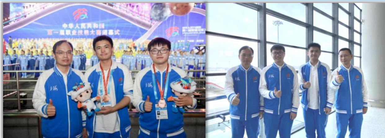
2020年全国职业技能大赛（国家级一类竞赛）