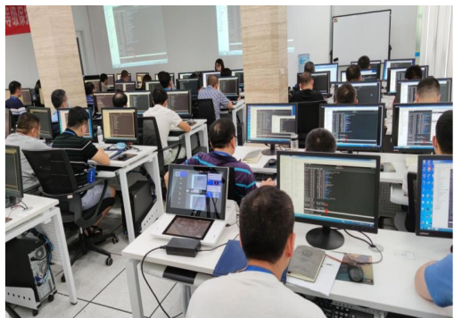
（初级）线下师资培训班