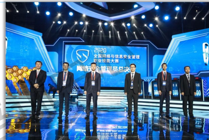
2020年全国网络与信息安全管理职业技能大赛（国家级一类赛）