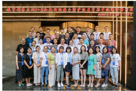
（中级）线下师资培训班