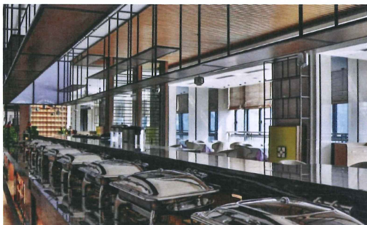
②北投大厦的食堂 5 楼可支持微信支付宝付款