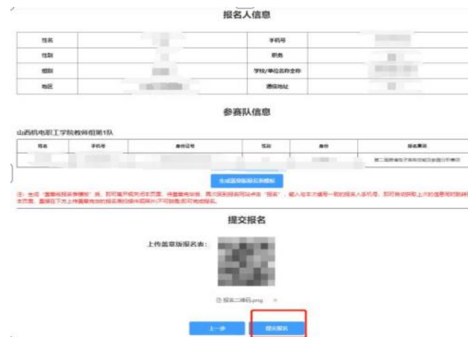
上传证明材料并提交